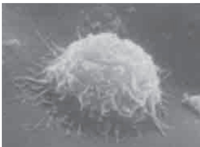
FIGURA 2 – Interação de um mioblasto com superfície de um biomaterial (ORÉFICE et al. , 2006)

Em consonância com as Metas do Milênio, os profissionais da Odontologia necessitam refletir sobre a escolha dos materiais a serem empregados como substitutos a tecidos vivos perdidos. A nanotecnologia se desenvolve